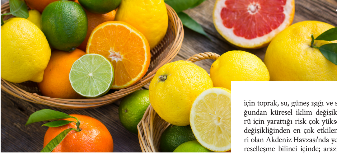
Narenciye çeşitleri, Türkiye'nin yaş meyve sebze ihracatında en önemli ürün grubunu oluşturuyor.

ve Kontrol Genel Müdürlüğü, sektör sorunlarını büyük bir önemle takip etmekte olup çözüm arayışı için sektör paydaşları ile düzenli olarak yüz yüze toplantılar gerçekleştirilmektedir. Üretim, istihdam ve ihracata yönelik politikalar oluşturularak AR-GE, inovasyon, tasarım, markalaşma ve hedef pazara giriş konularında yüksek teknoloji ve katma değerli ürünler ihraç edilmesi amacıyla hâlihazırda Ticaret Bakanlığımız tarafından yürütülen ihracat destekleri mevcuttur. İhracatçılara sunulan teşvik programları bulunduğumuz dönemde yeterli olmakla birlikte sektör sorunları göz önüne alındığında ileriki dönemde daha fazla teşviğe ihtiyaç duyulabilir." dedi.