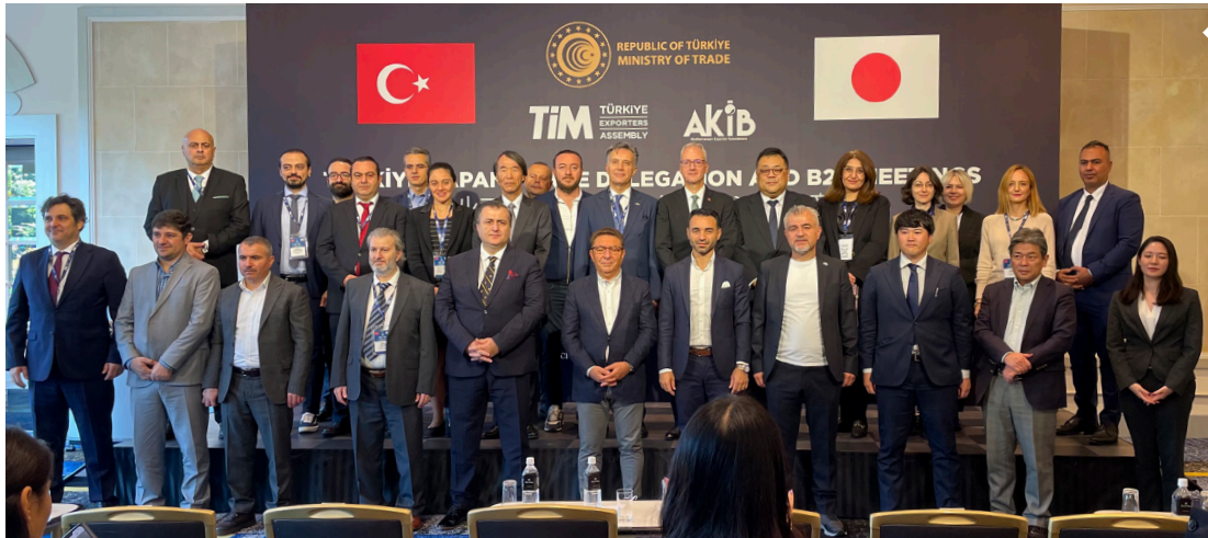
Japonya (Tokyo) Genel Ticaret Heyeti'ne gıda, otomotiv, çelik, madencilik, inşaat ve yapı sektörlerinde faaliyet gösteren 11 firma katıldı.