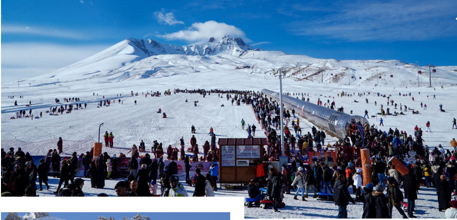
Erciyes Dağı; modern tesisleri, geniş kayak pistleri ve doğal kar kalitesiyle Türkiye'nin en önemli kış sporları ve kayak merkezleri arasında yer alıyor.

Türkiye Kültür Yolu Festivali'ne ev sahipliği yapmaya hazırlanan Kayseri'nin zengin kültürel mirasını, eşsiz doğal güzelliklerini ve modern turizm imkânlarını tanıtmak amacıyla dijital ortamda 44 rota oluşturuldu. Kayseri'nin tarihi, kültürel ve doğal değerleri ile gastronomi alanındaki zenginliğini yansıtan turizm portalı, kenti keşfetmek isteyenler için bir rehber gibi hizmet veriyor.