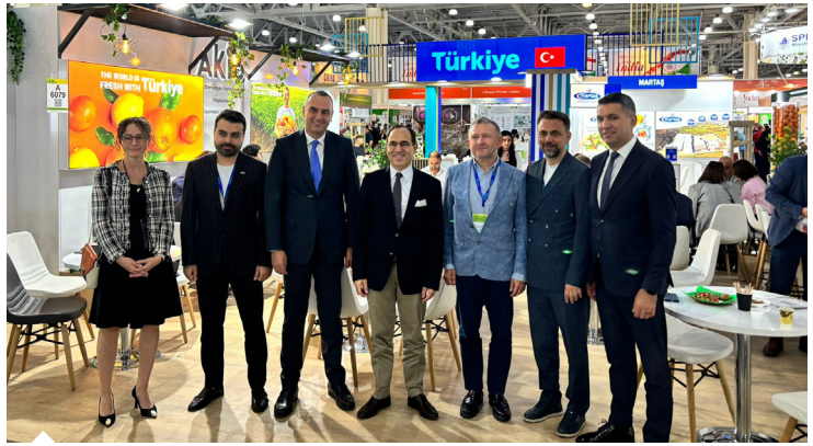
Akdeniz Yaş Meyve Sebze İhracatçıları Birliği'nin milli katılım organizasyonunu üstlendiği fuarlarda Türkiye pavilyonu ve tanıtım etkinlikleri göz dolduruyor.

desteklenen Turquality programı kapsamında, Rusya, Almanya ve Polonya pazarlarındaki payımızı korumak ve büyümek hedefiyle tanıtım faaliyetleriyle birlikte söz konusu ülkelerde üst düzey yetkililerle Yaş Meyve Sebze Zirvesi planlanmaktadır. Bu bağlamda ilk olarak Rusya Federasyonu'nda 28 Kasım 2024 tarihinde üst düzey Türk ve Rus yetkililerin katılımıyla "Türkiye-Rusya Federasyonu Yaş Meyve Sebze Zirvesi" gerçekleştirilmiştir. Turquality programı kapsamında kalite, ürün imajı, doğal-organik ve sağlıklı nitelikler, fiyat ve rekabetçilik ve sürdürülebilir tarım gibi yönleriyle Türk yaş meyve sebzelerini ön plana çıkaran içerikler ile tanıtım filmleri, TV programları, sosyal medya ve outdoor çalışmaları yapılmaktadır."