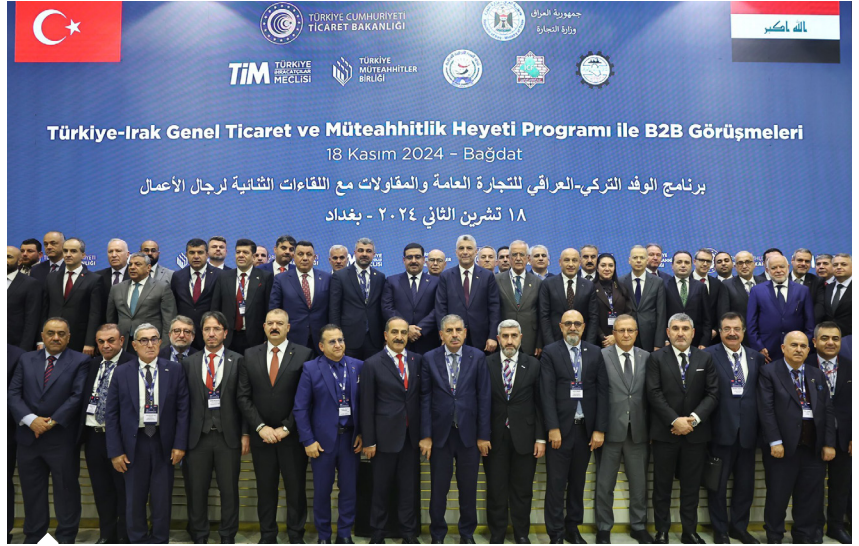
Türkiye-İrak Genel Ticaret ve Müteahhitlik Heyeti Programı'na Ticaret Bakanı Ömer Bolat'ın liderliğinde Türkiye'den 30'un üzerinde firmadan 100'ü aşkın iş insanı katıldı.

İki ülke arasında ticaret hacminin 2023'te 14,3 milyar dolar düzeyinde olduğunu hatırlatan Gültepe, şunları söyledi: "Irak'la dış ticaretimizde Türkiye lehine büyük bir fark bulunuyor. 2023'te 14,3 milyar dolarlık dış ticaret hacminin 12,8 milyar doları bizim ihracatımızdan kaynaklanıyor. Bu yıl ocak-kasım dönemindeki ihracatımız ise 11 milyar dolara yaklaştı. Irak, en çok ihracat gerçekleştirdiğimiz ülkeler arasında dördüncü sırada yer alıyor. Komşu ülkeler arasında ise en çok ihracatı Irak'a gerçekleştiriyoruz. Irak'a ihracatta öne çıkan sektörlere baktığımızda hububat, kimya ve mobilya ilk üçte yer alıyor. Ocak-ekim döneminde Irak'a 1,8 milyar dolarlık hububat, 956 milyon dolarlık kimyevi madde ve 923 milyon dolarlık mobilya, kâğıt ve orman ürünü ihraç ettik. Gemi, yat ve hizmetleri, mücevher, yaş meyve sebze sektörlerimizin ihracatında da dikkat çekici artışlar var. Bu dönemde 24 sektörümüz Irak'a ihracatını artırdı. Irak, komşumuz